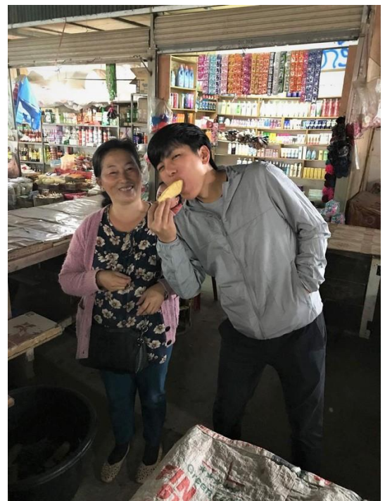
世界中で笑顔を増やせるよう頑張ります！！ ご支援ありがとうございました。^^